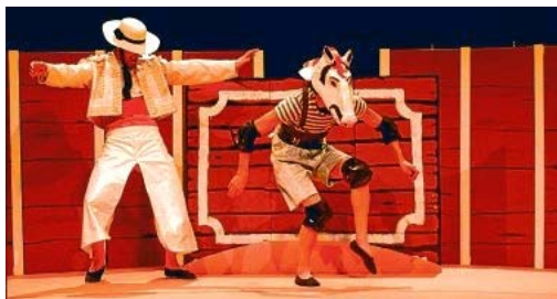
Mano a mano 8 Infinito de Córdoba y El Berberecho de las Rías Baixas, en una escena del montaje.